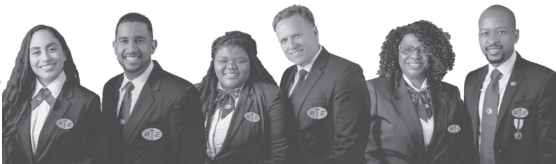
Departemantan'ny Asa Fanompoan'ny Tanora | Foibe Maneran-tany

Koa iangaviana ianao hamaky amim-pitandremana sy amimbavaka ireo toriteny ireo ary hihazona mandrakariva ao an-tsaina fa ny zava-dehibe kendrentsika dia ny hitia sy hanome voninahitra ny Raintsika ary hizara hoe iza moa Izy amin'ireo manodidina antsika, ary ny hitia ny olona rehetra, indrindra ireo mety ho nohadinoina.